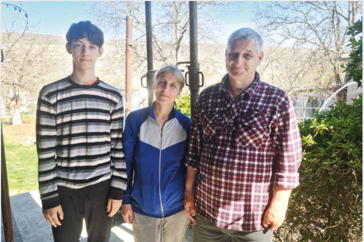
■ Familie Stratan

Nach Genesung hat der Mann die Möglichkeit wieder eine Arbeit zu bekommen. Die Notwendigkeit der Hilfe sollte jährlich überprüft werden.