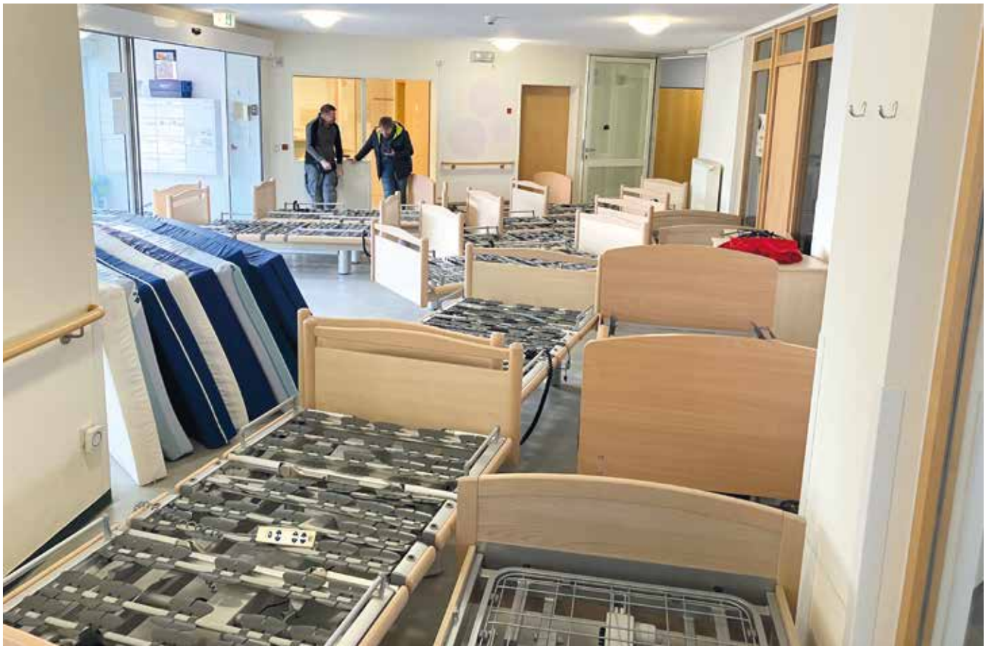
■ Die im Altenheim Berglen für den Hilfstransport nach Moldau bereitgestellten Betten und Matratzen vor der Verladung.