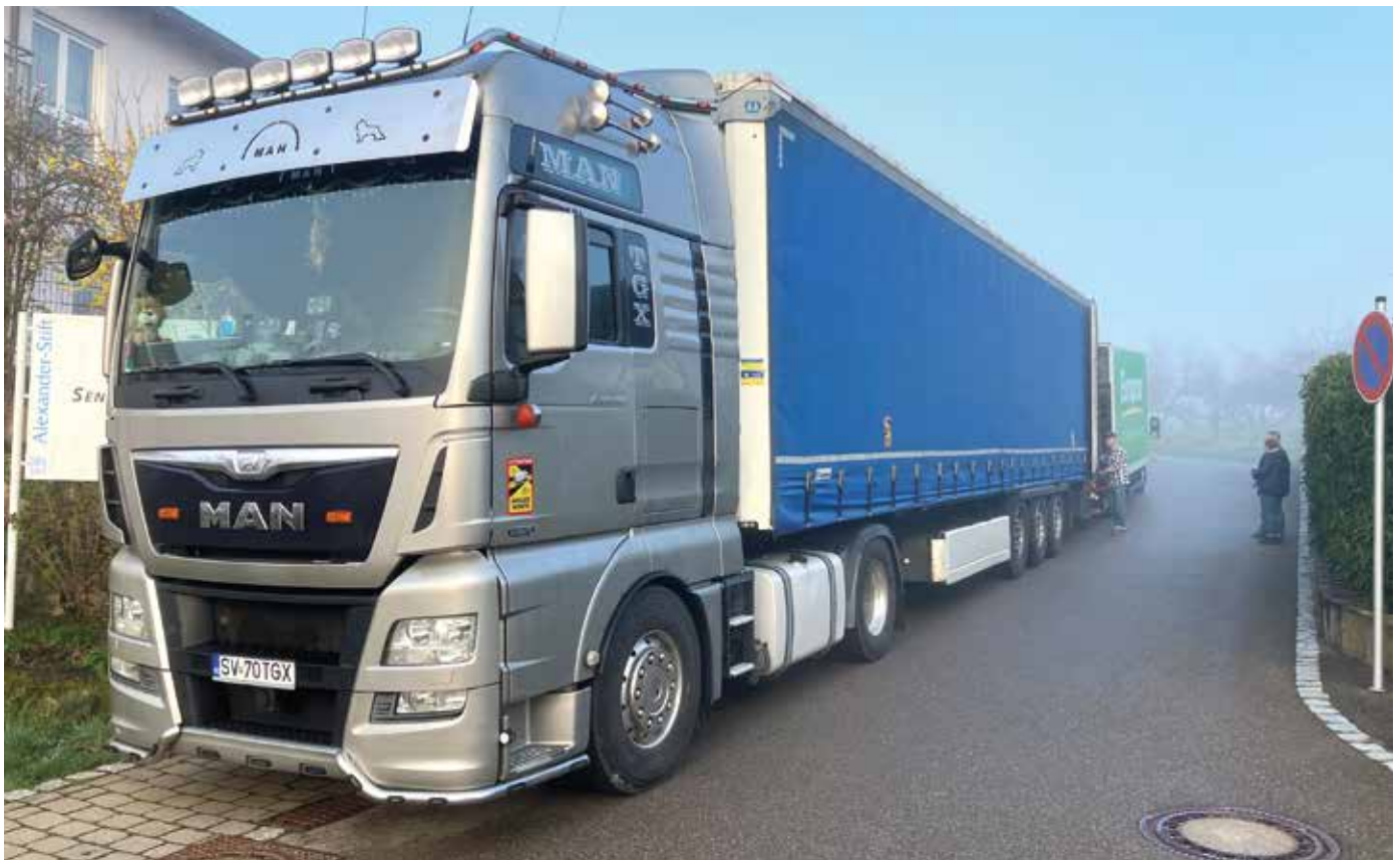
■ User Hilfstransport konnte die gesamte Ladung der Betten, Matratzen und Nachttische aufnehmen und direkt den Weg nach Moldau antreten.