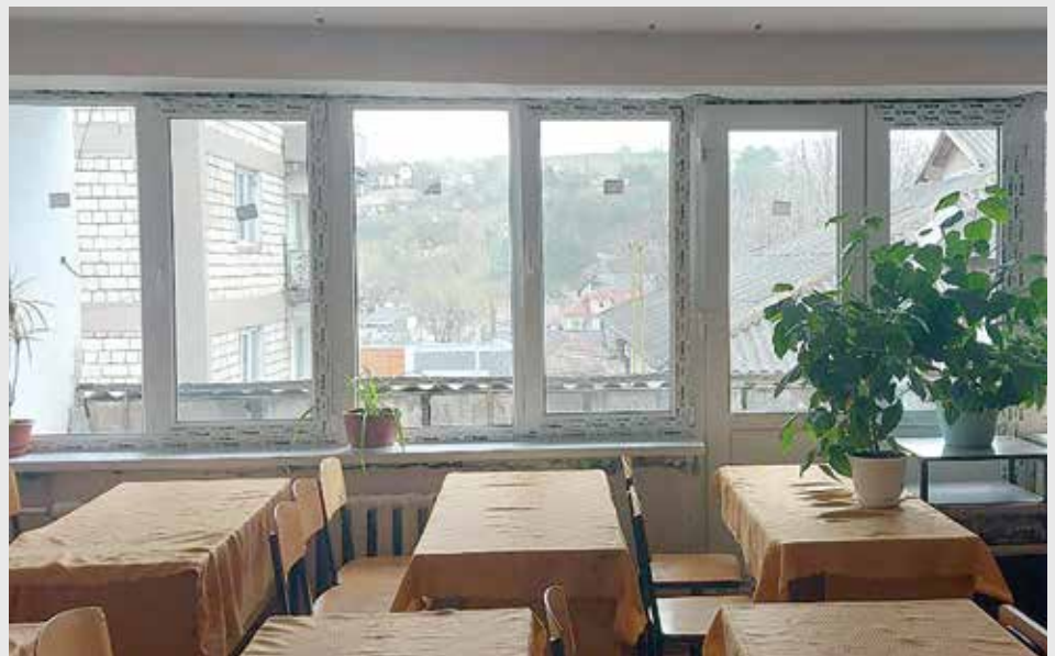
■ Im Bild links: ein renoviertes Schwesternwohnzimmer, im Bild rechts: ein im Wohnblock befindliches Schulungsraum. Die neuen Fenster sind eingebaut, jedoch müssen die Fensterlaibungen noch bearbeitet werden.

E s stellte sich heraus, dass es vor dieser Umbaumaßnahme nur möglich war, den Unterricht wegen der niedrigen Temperatur, mit Winterjacken durchführen zu können.