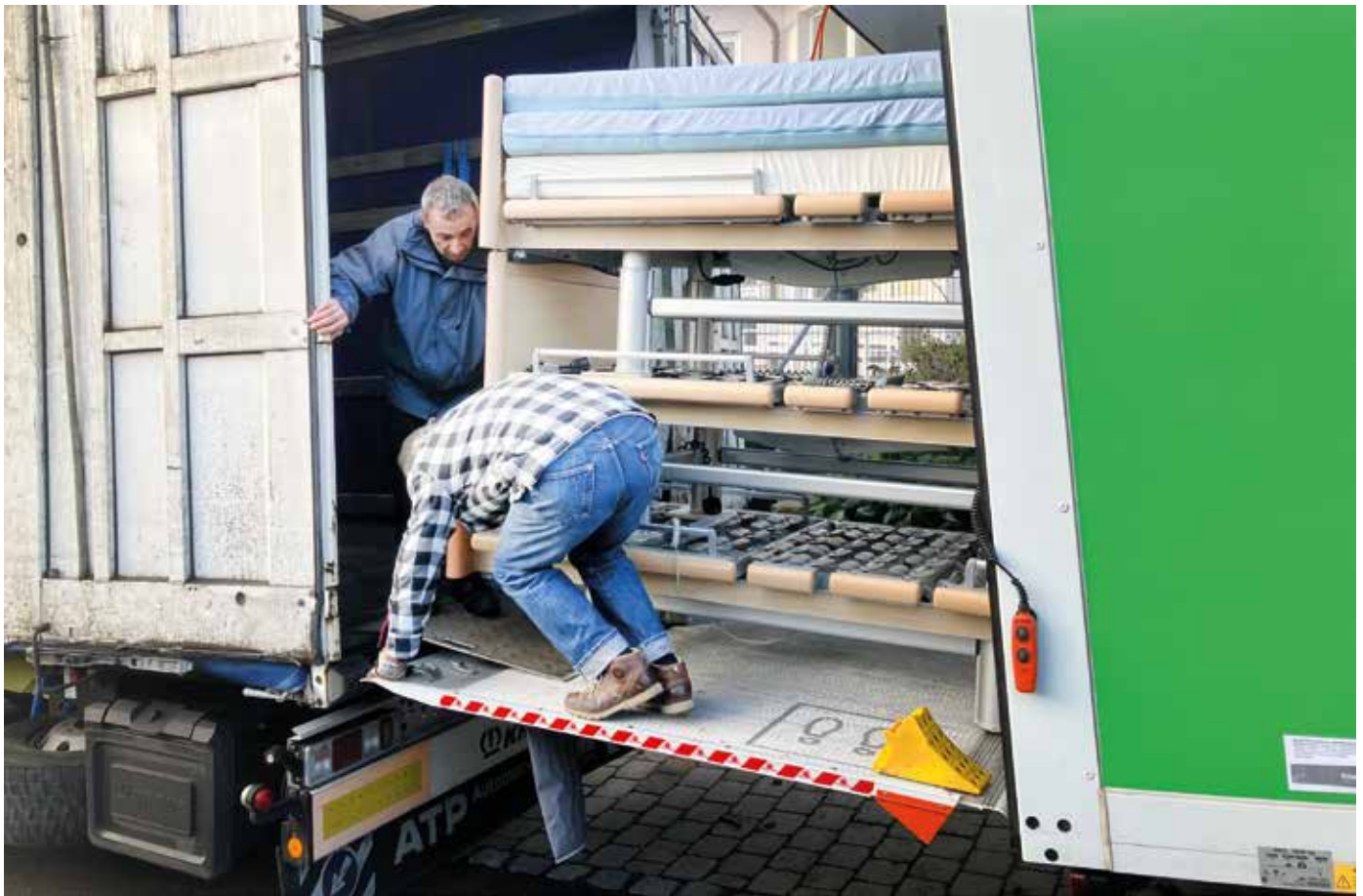
■ Die im Mietwagen übereinander gestapelten Betten wurden anschließend in den Hilfstransporter verladen.