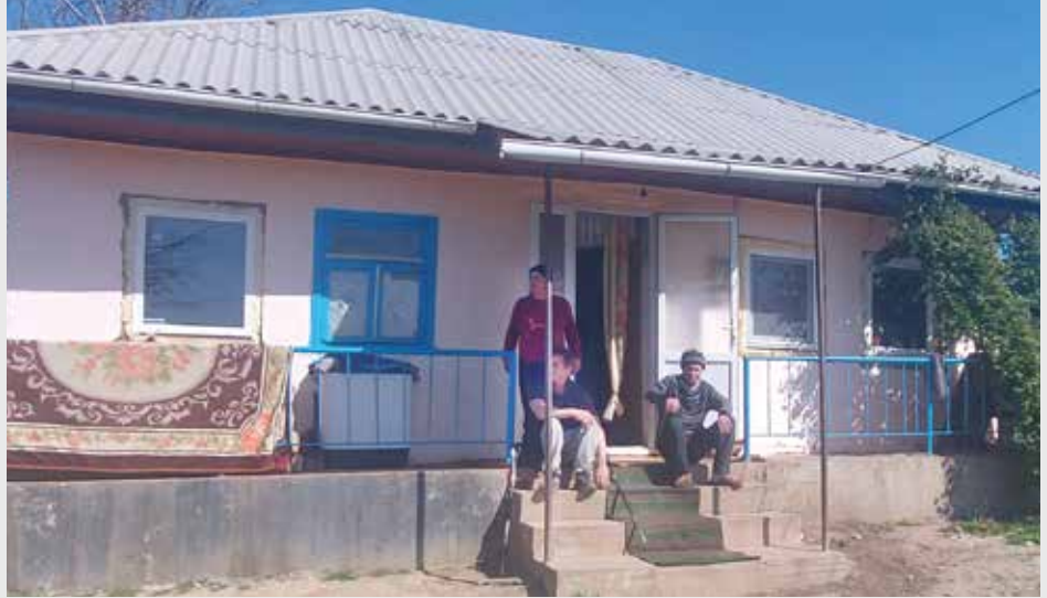
■ Das ist das Anwesen der Familie Garbu das alte Fenster ist noch in blauer Farbe.