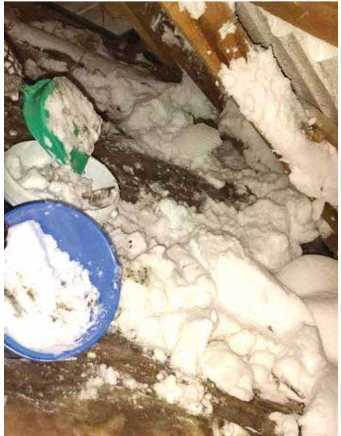
■ Eine Kindergarten Hilfskraft versucht den Schnee zu beseitigen, da die darunter liegenden Decken zweier Etagen durchnässt sind.