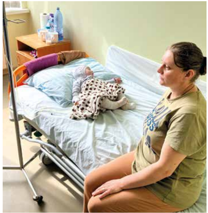
■ Schuld bewusst sitzt diese Mutter am Bett ihres Kleinkindes, welches schwere Verbrennungen aufweist.