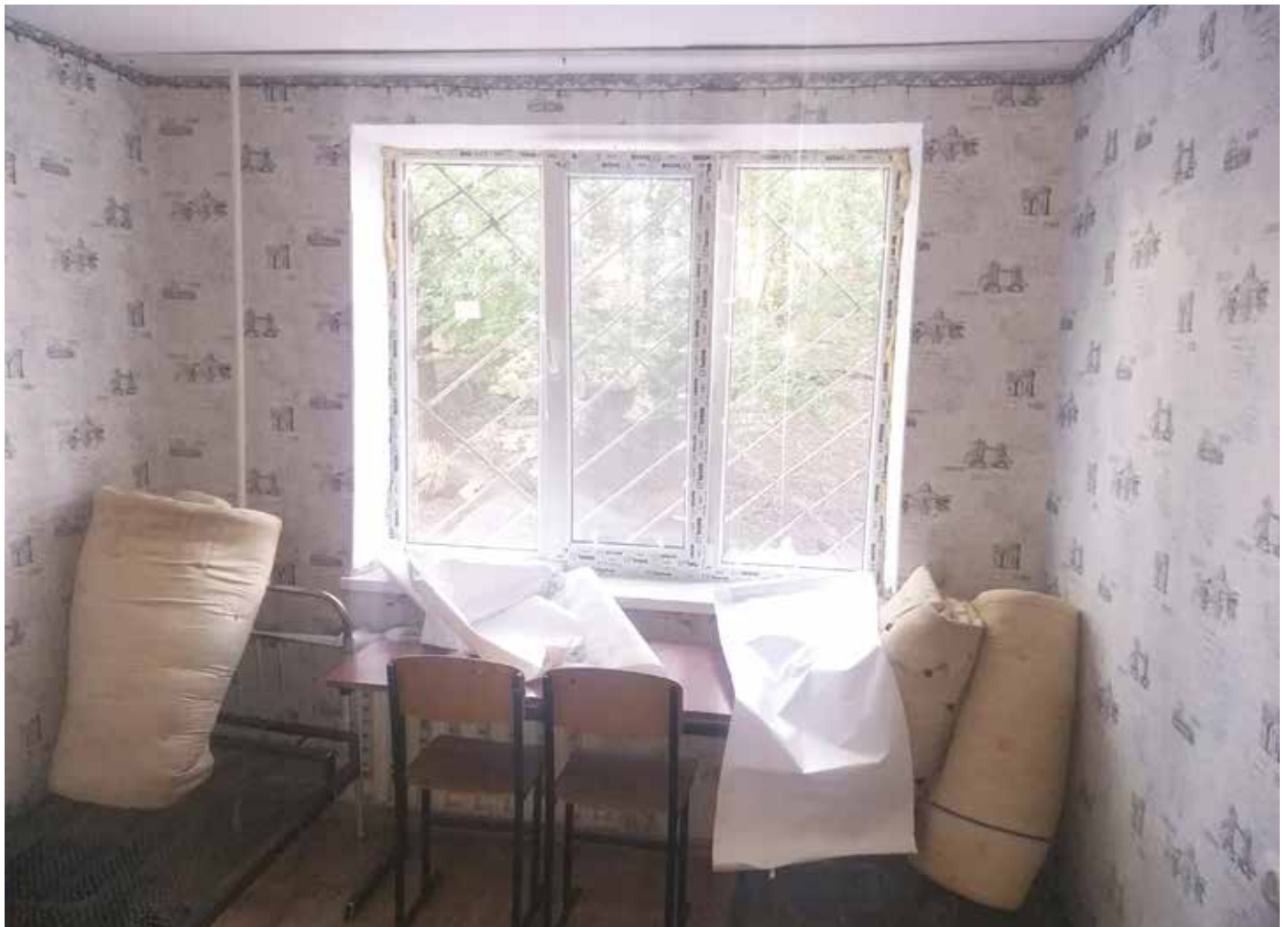
■ Ein renoviertes Zimmer im Schwesternwohnheim Orhei. Noch sind die neuen Fenster eingeschäumt und die Fensterlaibungen müssen noch fertig gestellt werden. Das Zimmer ist tapeziert und wird in Kürze bezogen.

erzählte, die Bewohnerinnen hätten mit Freude vermerkt, dass es „warm“ geworden wäre und man nicht ständig mit dicken Jacken im Haus herumlaufen müsse.