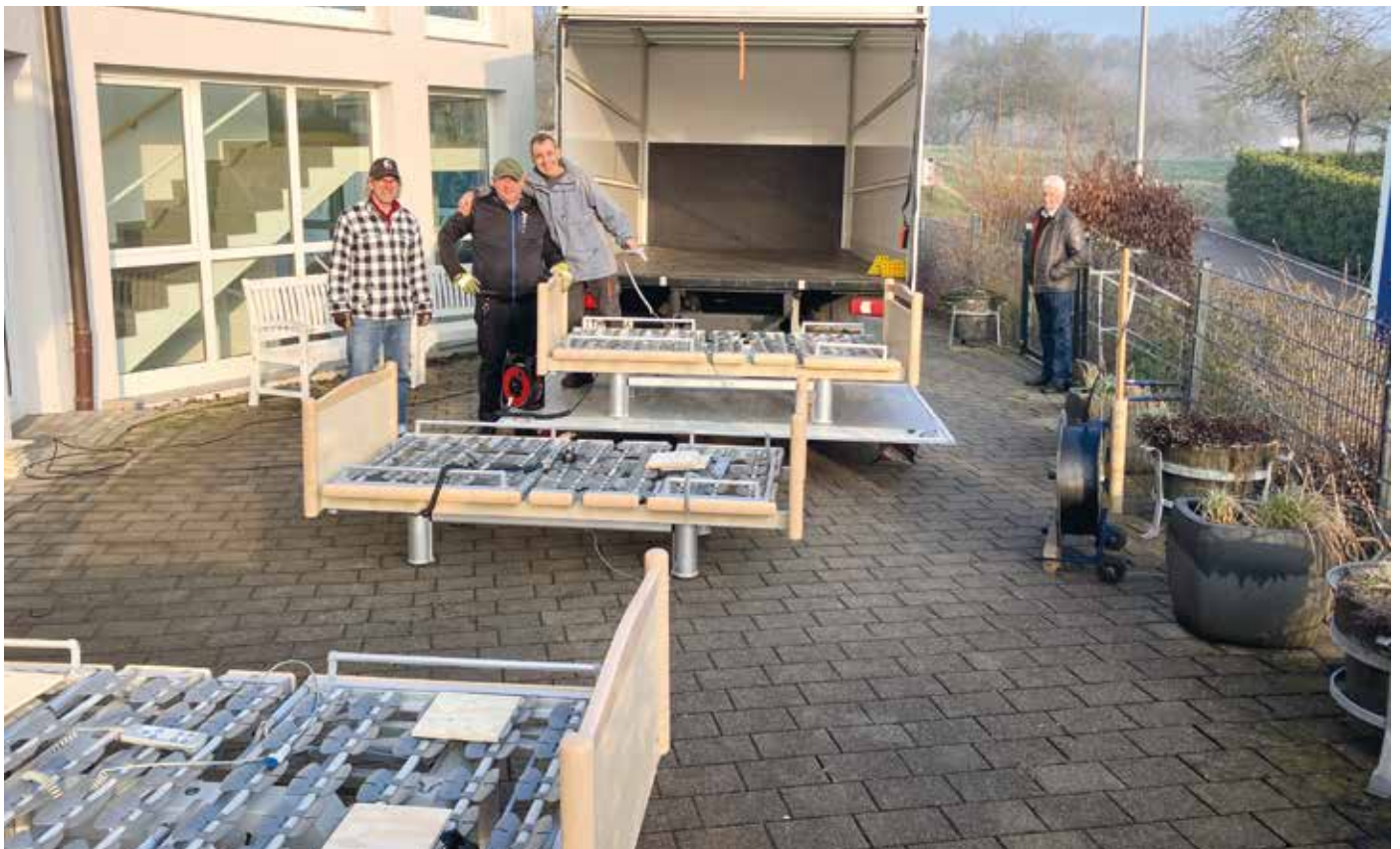
■ Mangels eines Gabelstaplers mussten wir einen Mietwagen mit Hebebühne einsetzen, damit wir die Betten übereinander stapeln konnten.