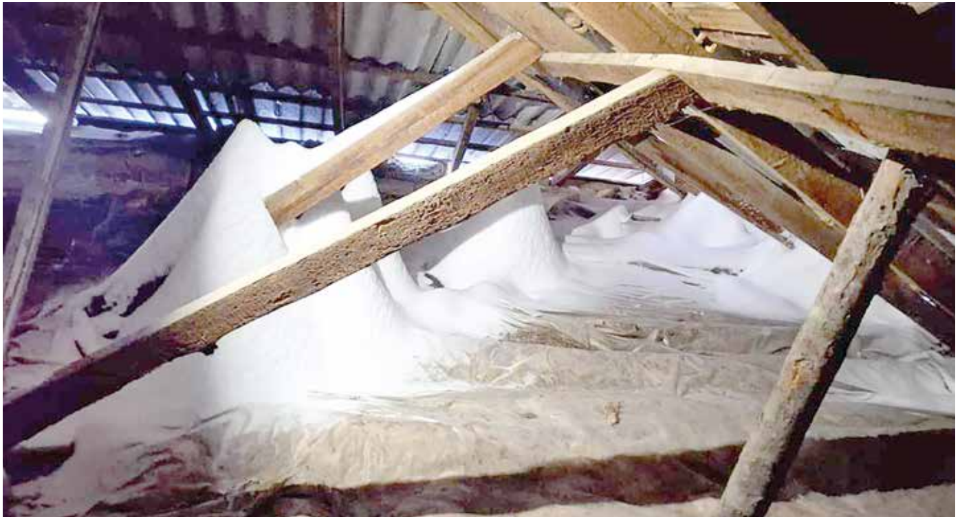
■ Bild des reparaturbedürftigen Daches im Kindergarten Puhoi.

So schneite es im letzten Winter durch die teilweise fehlenden Eternitplatten, was zur Folge hatte, dass die darunter liegenden Zimmerdecken nass wurden.