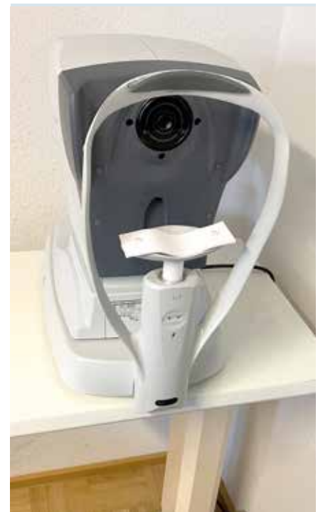
■ Eine sehr gut erhaltene Inneneinrichtung mit Metallschränken, fachspezifischen Geräten und medizinischen Instrumenten mussten verladen werden.