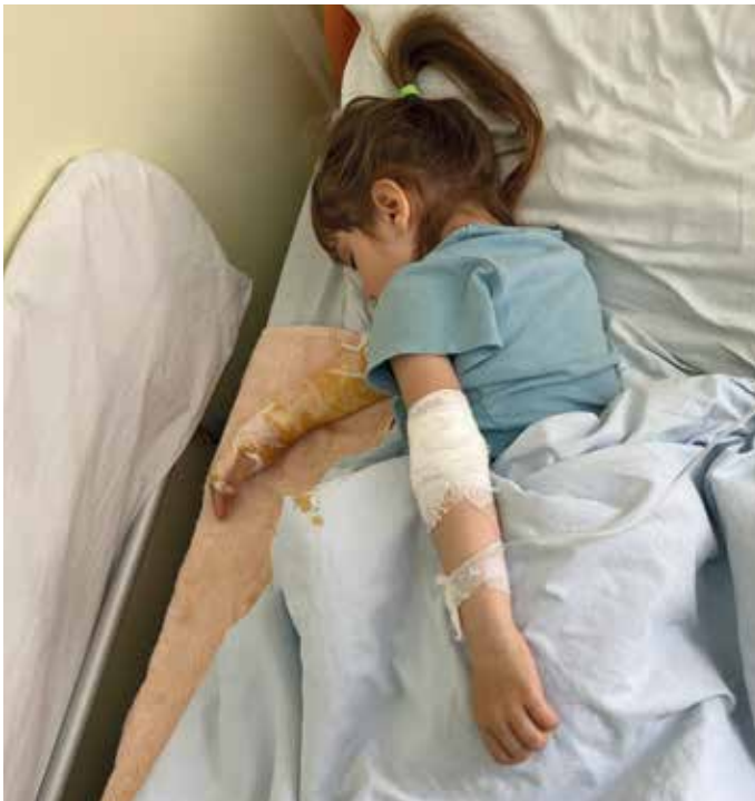
■ Dieses Mädchen erlitt schwere Feuer Verbrennungen an beiden Armen.